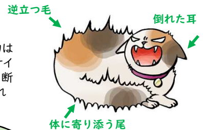
恐怖のサインの例 (猫)

痛みや恐怖などを感ずると、右図の例のように、動物は特定のサインを発します。動物福祉ではこのようなサインに注目し、苦痛を感じているかどうかを客観的に判断します。そして、その原因は何か、解決するにはどうすればいいかを論理的に考えます。