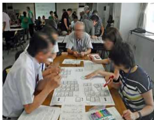
第2講の様子写真その2