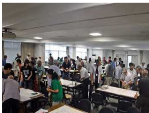
第3講の様子写真その2