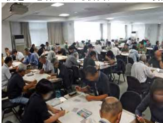
第3講の様子写真その1