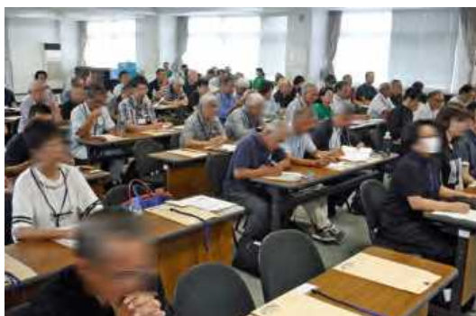
第1講の様子写真その1