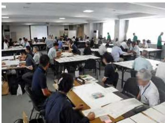
第2講の様子写真その1