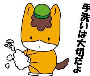
群馬県のマスコット 「ぐんまちゃん」