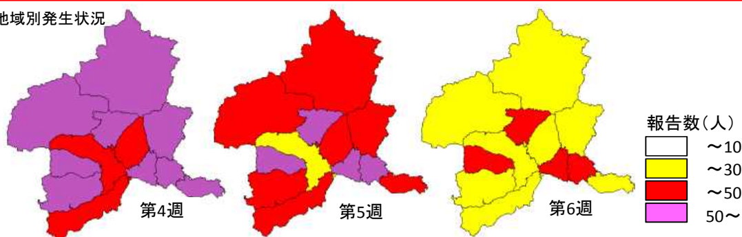
インフルエンザ地域別発生状況 （第4週～6週）

★インフルエンザ報告数は減少しましたが、警報解除には至っていません。引続き不要不急の外出は控え、人混みを避けましょう。また、手洗いの徹底や咳エチケットを守りましょう。