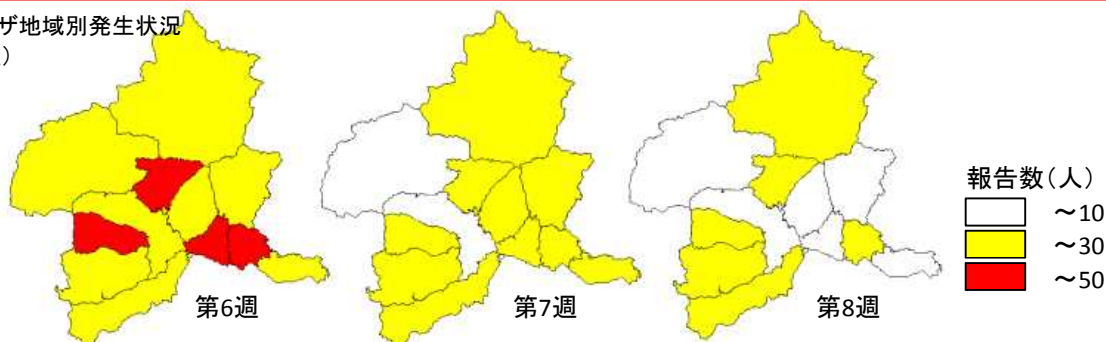
インフルエンザ地域別発生状況 （第6週～8週）

★群馬県のインフルエンザ定点当たり報告数は警報終息基準値を下回りましたが、県内には高い地域もあります。手洗いの徹底や咳エチケットを引き続き守りましょう。