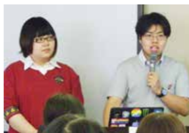
ハレルワのみなさん

令和1年7月24日(水) 法務省委託事業 ○とらいあんぐるんLGBT講演会 「LGBTってなんだろう? ~知っておきたい多様性のこと~」