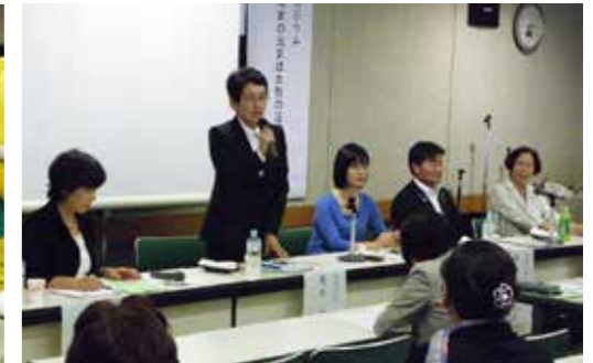
●大盛況だったシンポジウム「ぐんまの元気は女性の活躍から パートII」