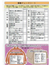
P8 備蓄チェックシート

防災ノートは、県ホームページに本冊子のデータ（PDF）が掲載してありますので、ダウンロードして御活用いただけます。