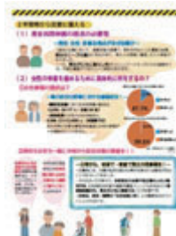
P3 平時から災害に備える