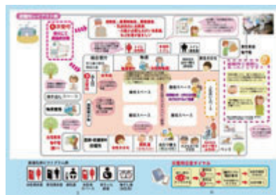
P5・6 避難所レイアウト例