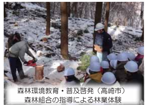
森林環境教育・普及啓発（高崎市） 森林組合の指導による林業体験