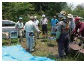
刈払機の安全講習会