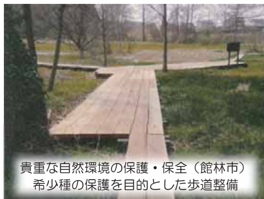
貴重な自然環境の保護・保全（館林市） 希少種の保護を目的とした歩道整備