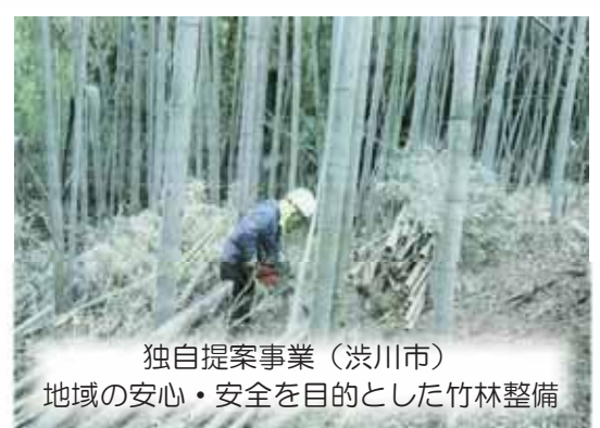
独自提案事業（渋川市） 地域の安心・安全を目的とした竹林整備