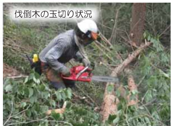
伐倒木の玉切り状況