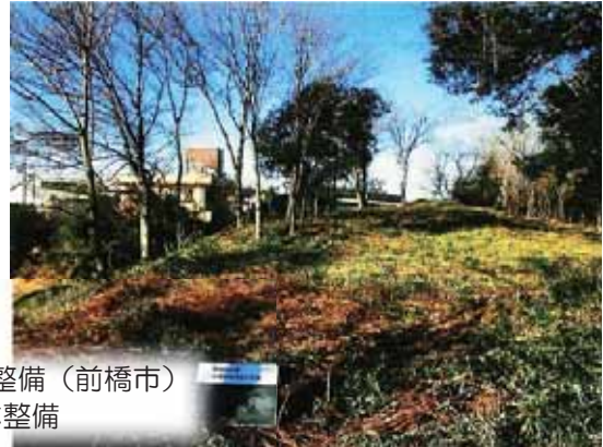
荒廃した里山・平地林の整備（前橋市） 史跡周辺の森林整備