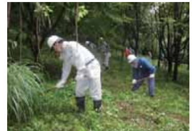
ボランティア体験会