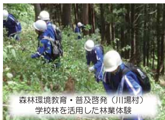
森林環境教育・普及啓発（川場村） 学校林を活用した林業体験