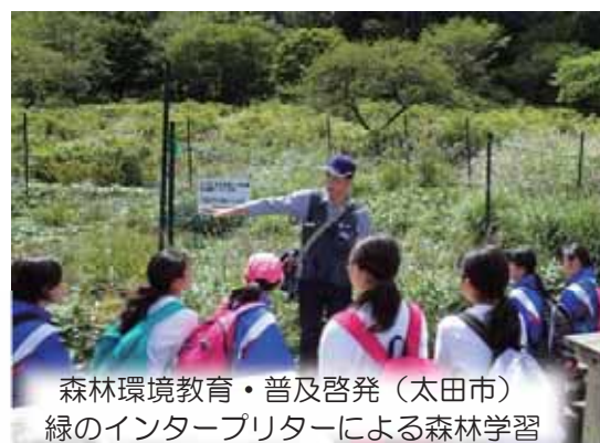
森林環境教育・普及啓発（太田市） 緑のインタープリターによる森林学習