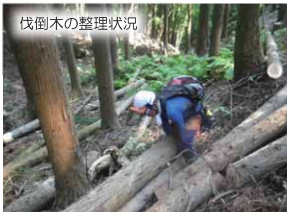
伐倒木の整理状況