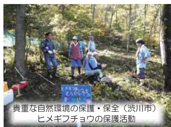
貴重な自然環境の保護・保全（渋川市） ヒメギフチョウの保護活動