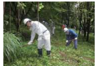
ボランティア体験会