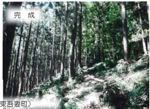
水源林機能増進 (東吾妻町)