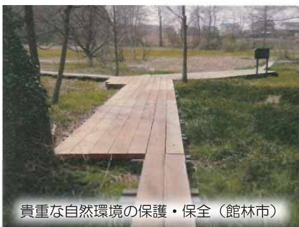
貴重な自然環境の保護・保全（館林市）