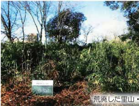
荒廃した里山・平地林の整備（前橋市）