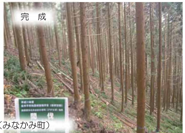
条件不利地森林整備 (みなかみ町)