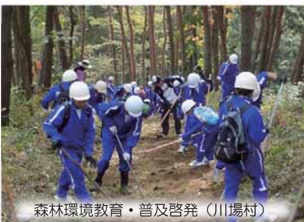
森林環境教育・普及啓発（川場村）