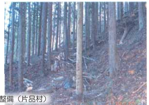
荒廃した里山・平地林の整備（片品村）