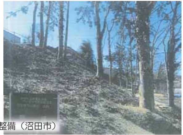
荒廃した里山・平地林の整備（沼田市）