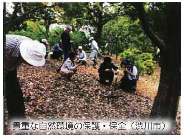
貴重な自然環境の保護・保全（渋川市）