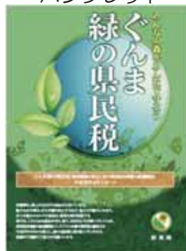
子供向けパンフレット