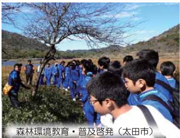
森林環境教育・普及啓発（太田市）