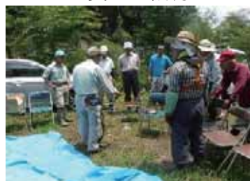
刈払機の安全講習会