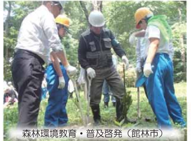
森林環境教育・普及啓発（館林市）