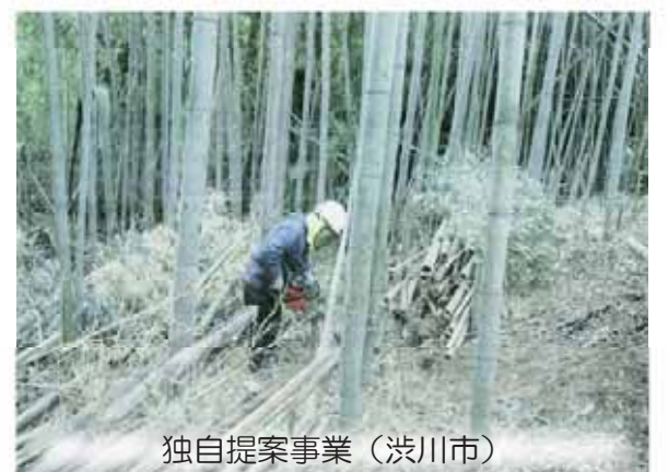
独自提案事業（渋川市）