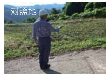
相対照度の測定の様子