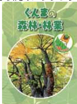
子供向けパンフレット