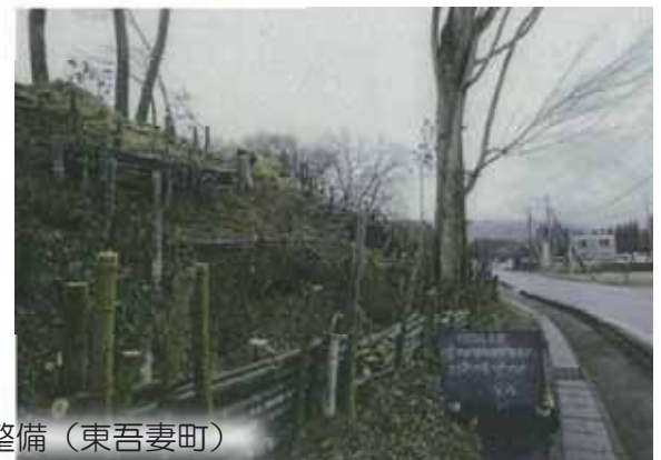
荒廃した里山・平地林の整備（東吾妻町）