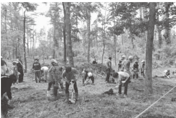
ボランティアによるマツ枯れ跡地の森林再生

また、マツ枯れ跡地には、シノなどが生えてしまうため、自然に元の姿に戻ることはありません。