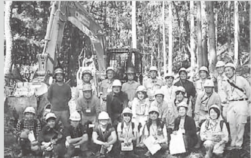
平成30年度ぐんま森林・林業ツアーの様子

林業は、高性能林業機械等の導入により、女性も働く職場に変わってきています。首都圏発着のバスツアーで女子学生の皆さんに林業現場の見学や体験を通じて今の森林・林業について知っていただき、群馬県で森林・林業に係わる仕事に就業することを考えるきっかけづくりを行っています。