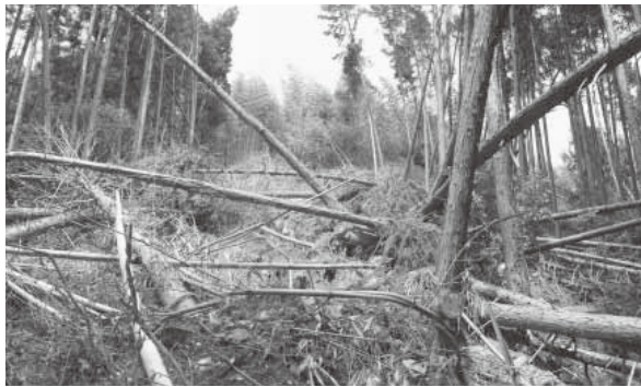
水害による山崩れて倒れたヒノキ