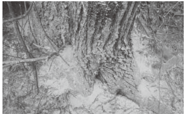
ナラ枯れ被害木は、葉が赤くなり大量の木屑が出る

シイタケ栽培の盛んな本県にはコナラ林が沢山あります。ドングリの木でもある大切なナラが無くなってしまわないよう、被害の発生状況などの調査を行い、早期発見と被害拡大の防止に努めます。