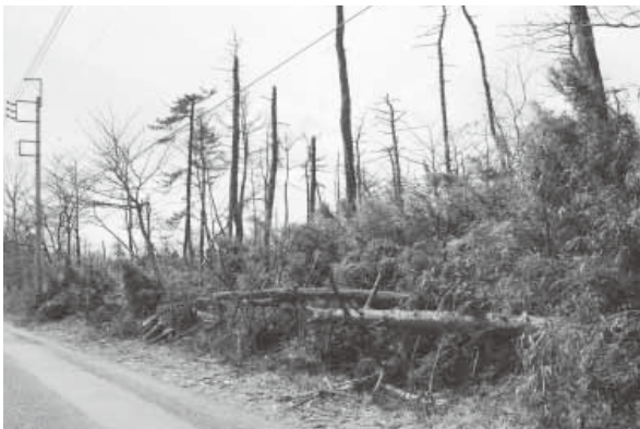
マツが枯れ、シノだらけになった森林

県内のマツ枯れ被害は、昭和53年頃から発生し、平成4年頃の被害が最も多く、現在でも赤城山や太田の金山、館林の多々良沼周辺などで多く発生しています。