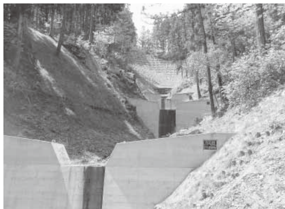
山地逕流を保全する治山ダム工