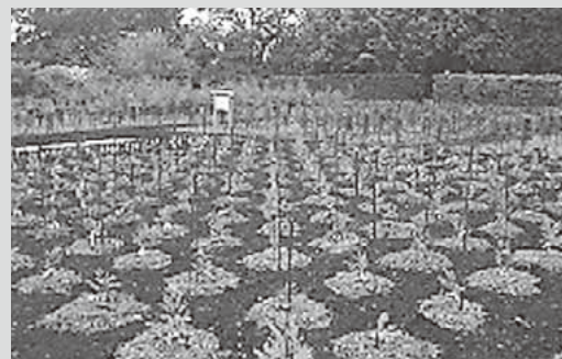
ミニチュア採種園(造成時)