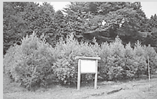
ミニチュア採種園(現在)