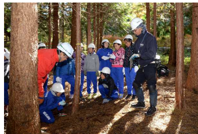
「緑のインタープリター」養成講座 フォローアップ研修 「緑のインタープリター」の活動状況