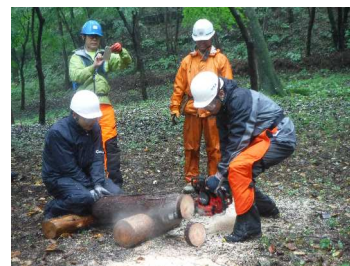
森林ボランティア体験