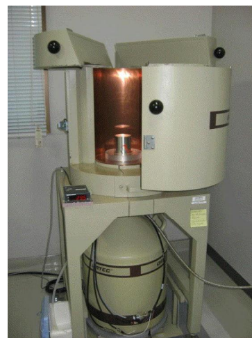
ゲルマニウム半導体検出器