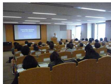
食品中の放射性物質基準値説明会