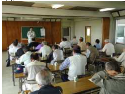
生産者向けの研修会