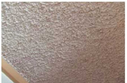
石綿含有吹付けバーミキュライト