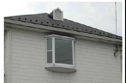
石綿含有窯業系サイディング