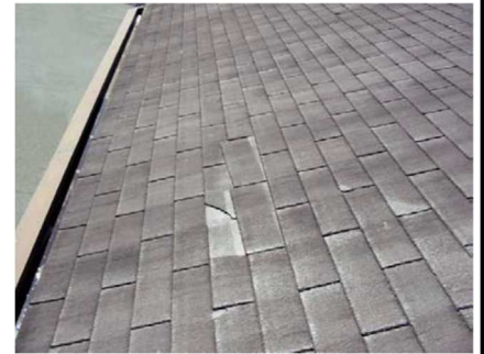
石綿含有住宅屋根用化粧スレート