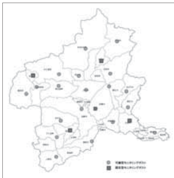
図2-4-4-1 モニタリングポスト配置図