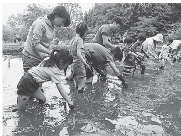
里山生活体験(田植)