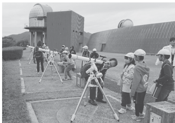
望遠鏡の使い方の学習