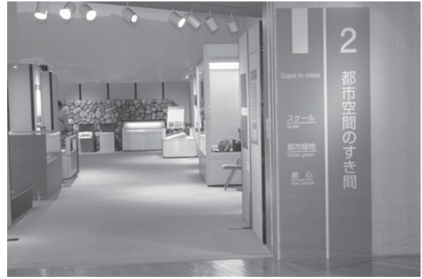
企画展「すき間片隅植物図鑑」