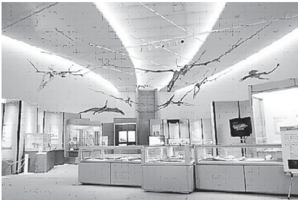
企画展「空にいどんだ勇者たち」

「空にいどんだ勇者たち」では、恐竜時代（中生代）の空の支配者であった翼竜の仲間を中心として、生物の進化の歴史の中で様々な動物たちによって何度も繰り上げられた空への挑戦の存在やその多様性について紹介しました。哺乳類の空への挑戦の一部として、ヒトによる空への挑戦も展示内容に含め、中でも外部動力源を使用しない陸上競技の跳躍競技やスカイダイビングなどのスカイスポーツも紹介しました。