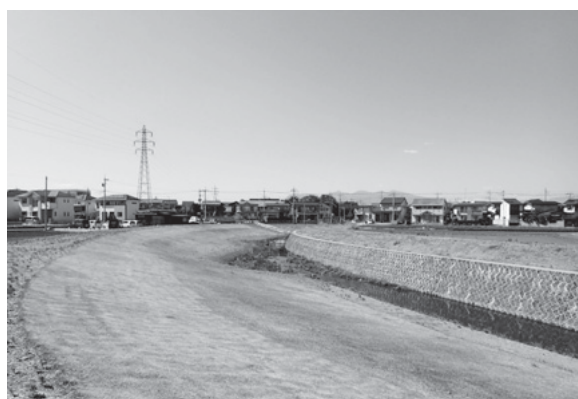
一級河川男井戸川 伊勢崎市

河川改修工事においては、設計時から地域住民の意見を取り入れるなどして、憩いの場を整備するなど、地元で親しまれる川づくりに取り組んでいます。