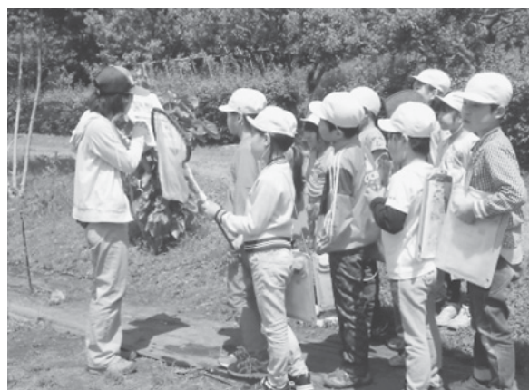
学校利用(野外解説)

理科や自然・環境についての学習を行う小学校等を支援するため、教員向け利用説明会や個別の下見などに対応するほか、「学校団体利用の手引き」を配布しています。また、学校利用に際して、野外に観察ポイントを設置するなど、学習ニーズに合わせたきめ細かなプログラムの相談に応じています。その結果、2020(令和2)年度は、11,389人の団体利用がありました。