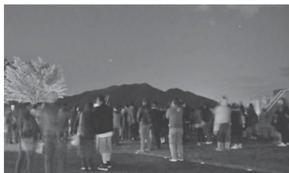
屋外での星空案内