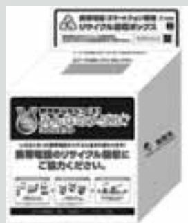
図2 「みんなのメダルプロジェクト」回収ボックスイメージ

詳しくは、プロジェクトホームページ ( http://www.toshi-kouzan.jp/ ) を御確認いただくか、お住まいの市町村にお問い合わせください。