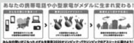
図1 「みんなのメダルプロジェクト」概要図

このプロジェクトは、日本全国の国民が参加してメダル製作を行う国民参画形式により実施します。また、日本のテクノロジー技術を駆使することで、リサイクル率100%を目指しています。このように、国民がメダル製作を目的に参画し、回収した小型家電から抽出された金属でメダルの製作を行うプロジェクトは、オリンピック・パラリンピック史上初めてとなります。