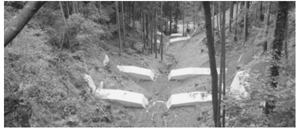
山地溪流を保全する治山ダム工