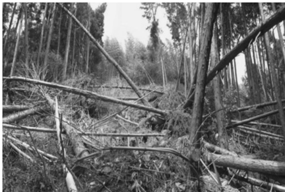
水害による山崩れて倒れたヒノキ

被害が発生した森林は、そのままにしておくと大変危険です。少しでも早く元の姿に戻るよう、被害木を整理して植え直し、森林の再生に努めています。