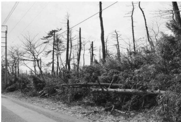
マツが枯れ、シノだらけになった森林

県内のマツ枯れ被害は、昭和53年頃から発生し、平成4年頃の被害が最も多く、現在でも赤城山や太田の金山、館林の多々良沼周辺などで多く発生しています。