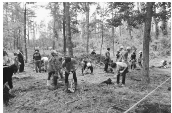
ボランティアによるマツ枯れ跡地の森林再生

また、マツ枯れ跡地には、シノなどが生えてしまうため、自然に元の姿に戻ることはありません。