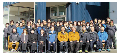
いきいきGカンパニー 女性活躍推進部門優秀賞

女性社員が得意な“顧客想い営業”でどんどん売上を上げていった群協製作所。女性社員の退職が続いた数年前、退職理由を聞くと全員から「残業」という言葉が出てきた。社員たちの声を聴いていくうちに、残業は社員の幸せを奪っていると痛感した。社長、専務、社員が一丸となって取組み、令和4年度残業0を実現するまでどのような取組みをしたのか。リアルな苦悩とその成果をお話いただきます。