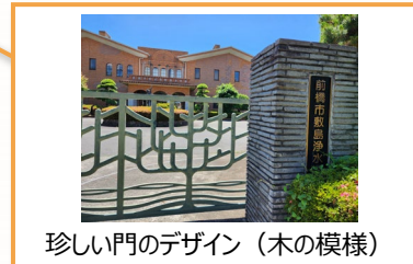
珍しい門のデザイン (木の模様)