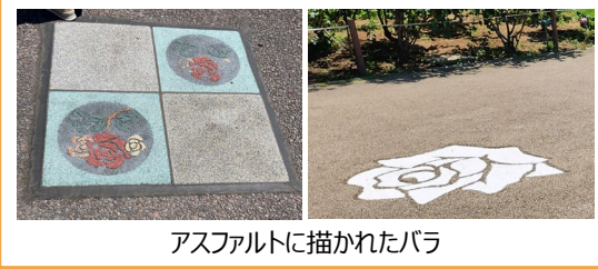
アスファルトに描かれたバラ