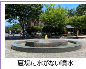
夏場に水がない噴水