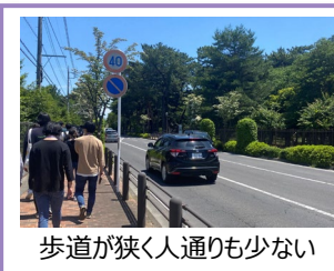
歩道が狭く人通りも少ない