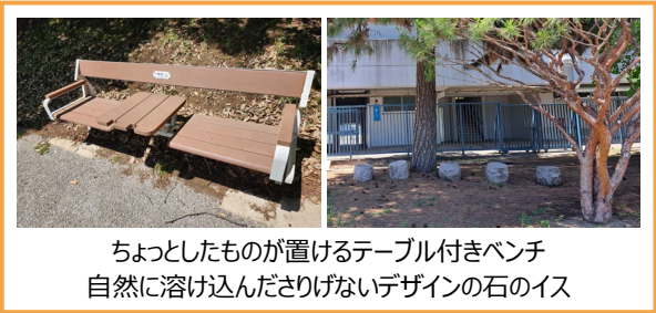
ちょっとしたものが置けるテーブル付きベンチ 自然に溶け込んださりげないデザインの石のイス