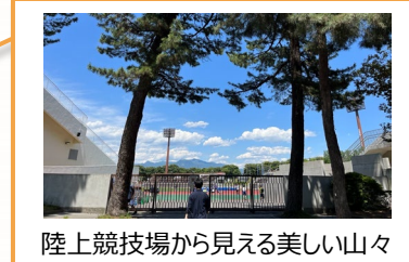
陸上競技場から見える美しい山々