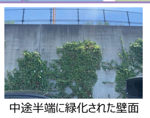
中途半端に緑化された壁面