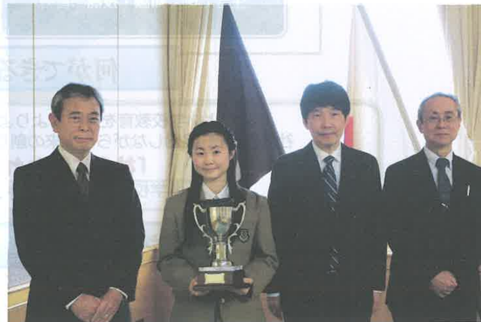
全国高校英語スピーチ優勝（2022）