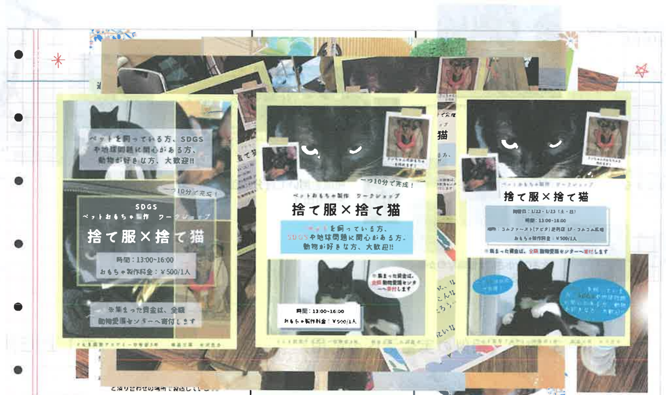
中3 コミュニティープロジェクトの例