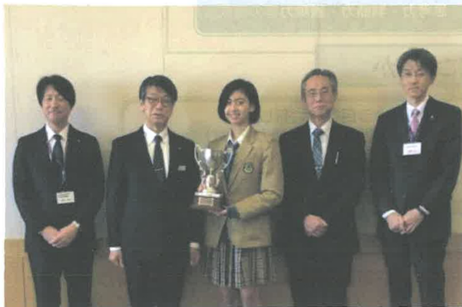
全国高校英語スピーチ優勝（2018）