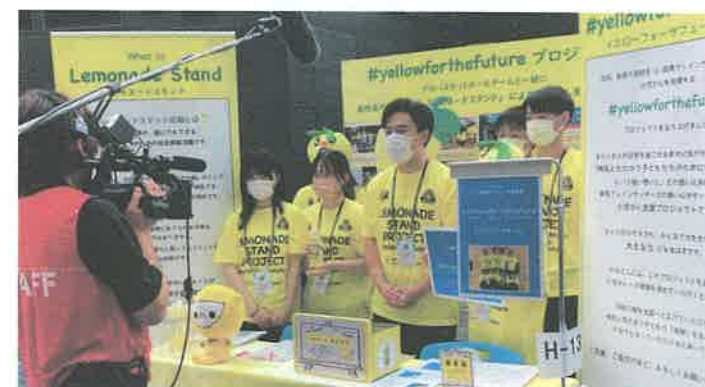
Yellow for the future ファンドレイズ

ブラジル人コミュニティとの交流の場を設けるため、サッカーを通じた地域・国際交流イベントを実施。延べ5回開催、幼稚園生から大人まで、のべ500人以上の参加。地域で問題となっている、ゴミの捨て方等の啓発活動も合わせて行う。