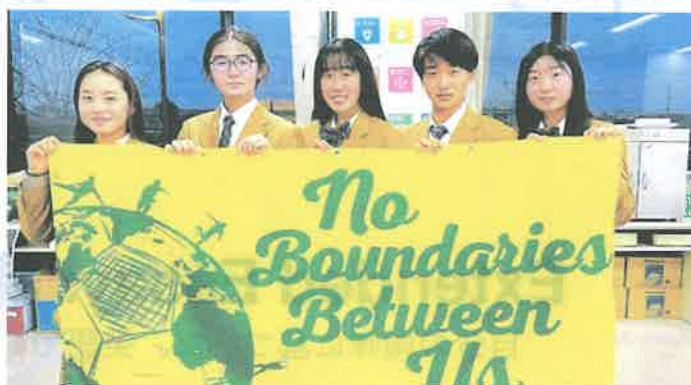
No Boundaries Between Us 地域・国際交流

太田市の店舗の協力を仰ぎ、コロナ禍の中でも安心して楽しめる地域イベントとして地域・店舗ビンゴを開催。イベントによる地域の活性化に繋げるイベントとして実施。