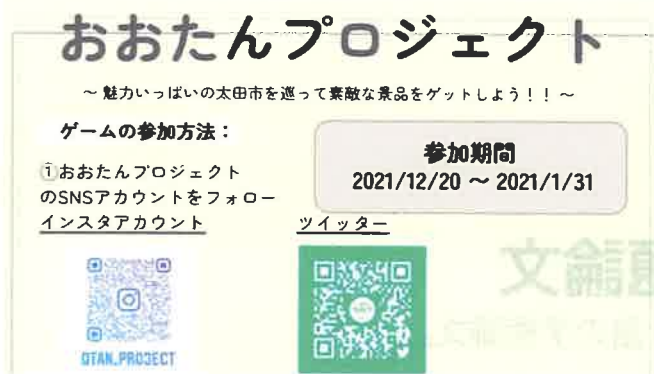
Otan Project 地元・地域活性化

太田市の店舗の協力を仰ぎ、コロナ禍の中でも安心して楽しめる地域イベントとして地域・店舗ビンゴを開催。イベントによる地域の活性化に繋げるイベントとして実施。