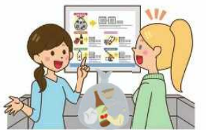
自治会や 地域を支える方