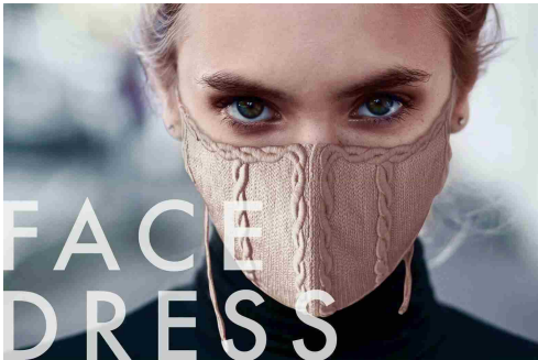
前回受賞商品（一部）