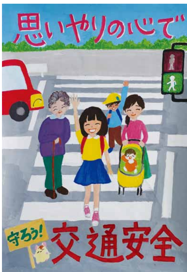
令和4年度JA共済群馬県小・中学生交通安全ポスターコンクール入賞作品 高崎市立東部小学校(入賞当時4年生) 柳澤怜依さんの作品