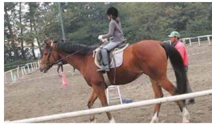
インストラクターが丁寧にサポートします

日 7月31日(月)までの希望する4回 開始時刻 午前9時、10時15分、11時30分、午後1時30分、2時45分 所 林牧場群馬県馬事公苑(前橋市富士見町) 対 当苑を初めて利用する、小学3年生から70歳までの乗馬初心者 定 各20人宛 ¥ 一般=1万4,200円、高校生以下=1万2,200円(受講料、保険料など) 受 7月15日(土)まで ※火曜日を除く 申し込み方法 電話予約後、所定の申込用紙 申・問 林牧場群馬県馬事公苑(☎027-288-7002)