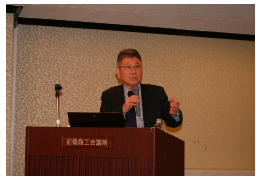
H25. 2. 4 イクボス養成塾