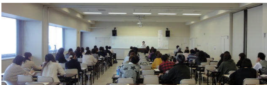
「主催講座」実施風景