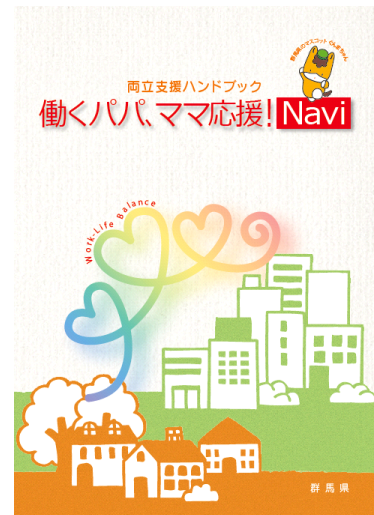
両立支援ハンドブック