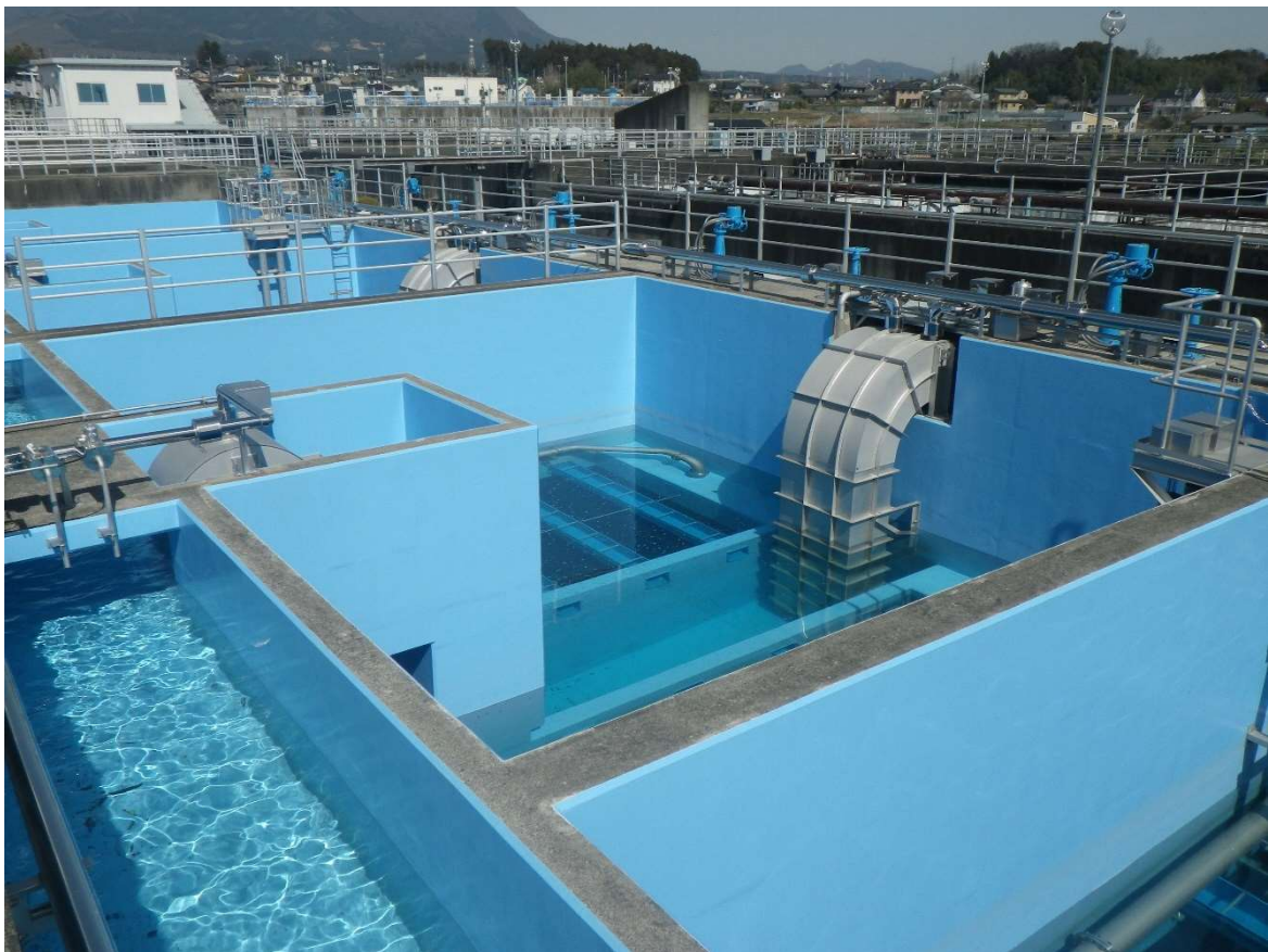
県央第一水道事務所 2系ろ過池