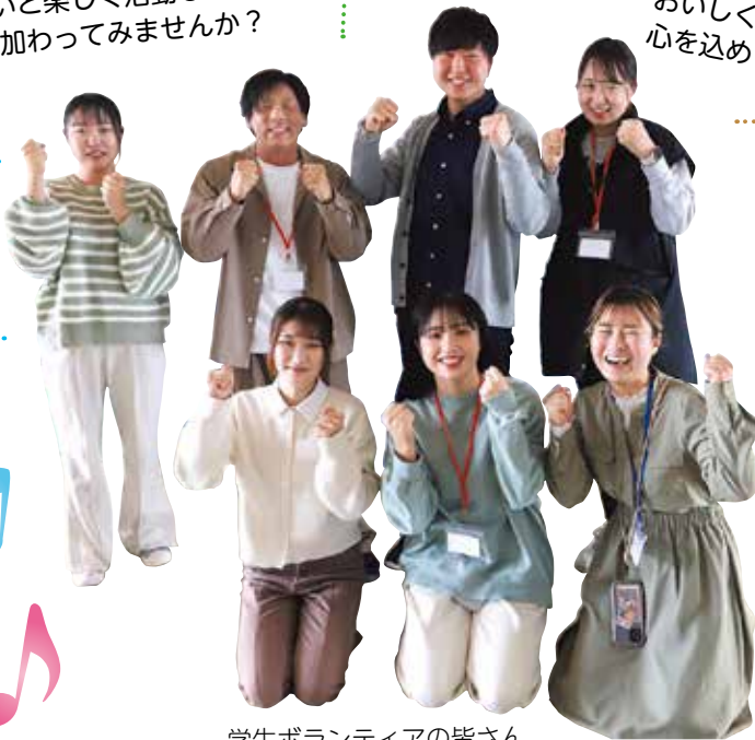
学生ボランティアの皆さん