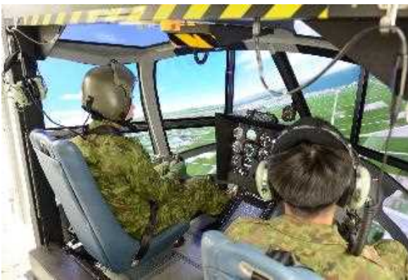
教育訓練による人材育成

地域の実情を踏まえ、住宅地、病院等の上空の飛行について最大限配慮する等の措置を講じます。また、駐屯地や演習場で 行うホバリング訓練は、努めて住宅地から離れた場所で行います。