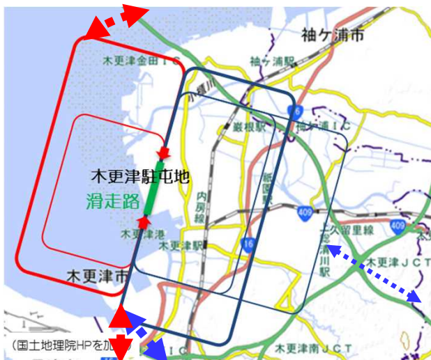
場周経路（イメージ）