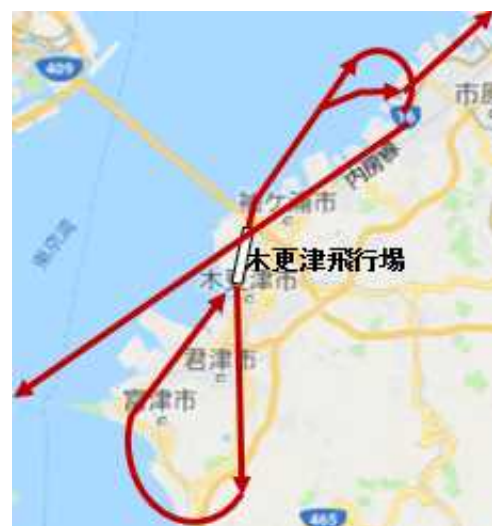
航空路誌に示す 離着陸経路（イメージ）