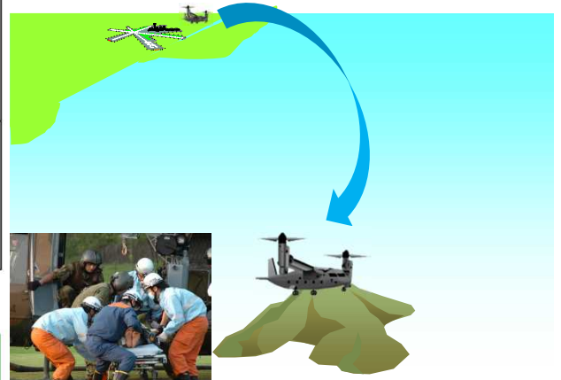
飛行場のない離島でも離着陸可能