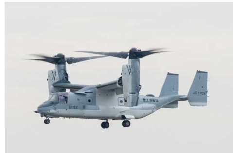
飛行開始(昨年11月6日以降)