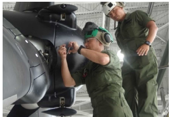
機体の点検・整備