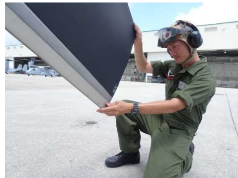
機体の到着、受入点検(昨年7月上旬～)