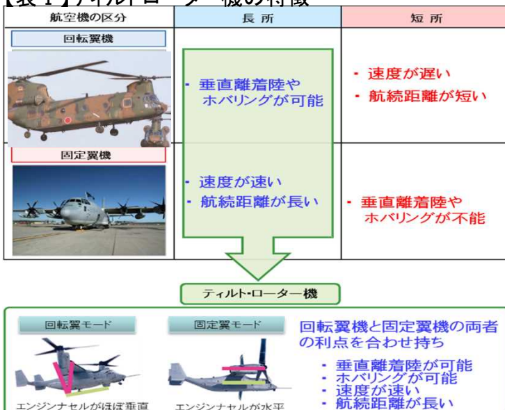
【表Ⅰ】ティルトローター機の特徴