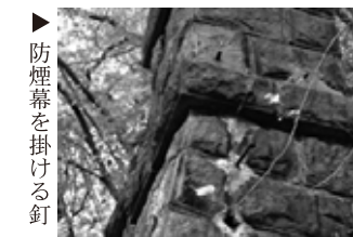
▶ 防煙幕を掛ける釘