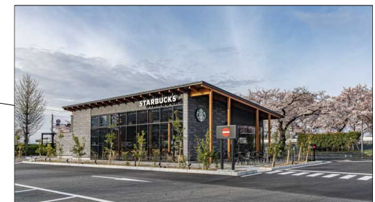
スターバックスコーヒー敷島公園店 (P-PFI)