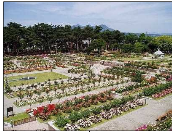
敷島公園門倉テクノバラ園