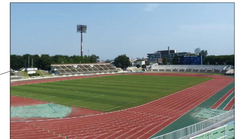
正田醤油スタジアム群馬