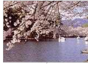
敷島公園ボート池