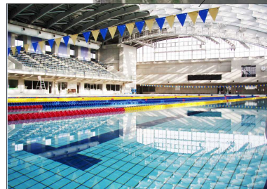
関水電業敷島プール