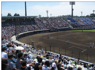
上毛新聞敷島球場