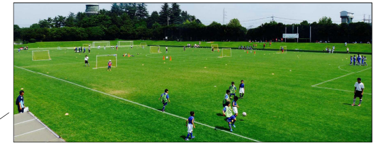
アースケア敷島サッカーラグビー場