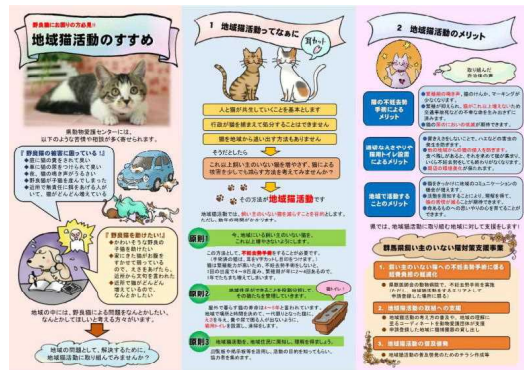
「地域猫活動のすすめ」リーフレット