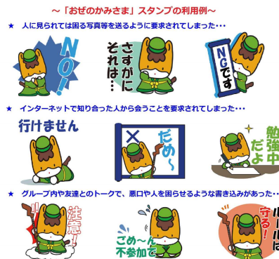
「おぜのかみさま」LINEスタンプ