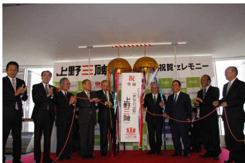
ユネスコ「世界の記憶」登録祝賀セレモニーの様子

皆様からお寄せいただいた寄附金を活用し、持ち運びが容易な上野三碑の小型レプリカ（約30センチ）を作成することができました。今後、観光イベントや講演会等で展示し、上野三碑の価値や魅力を多くの方々に知ってもらうとともに、本県のイメージアップや観光誘客に活用させていただきます。