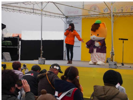
イベントで群馬県の温泉をPRをするぐんまちゃん

平成29年度は、群馬県が誇る魅力素材の一つである「温泉」をテーマに、全国各地のイベントで群馬の温泉の魅力をPRしたり、マスコミキャラバンを実施し、群馬の温泉をPRするぐんまちゃんが多くのメディアで紹介されるなど、「温泉といえば群馬県」というイメージの定着を図りました。