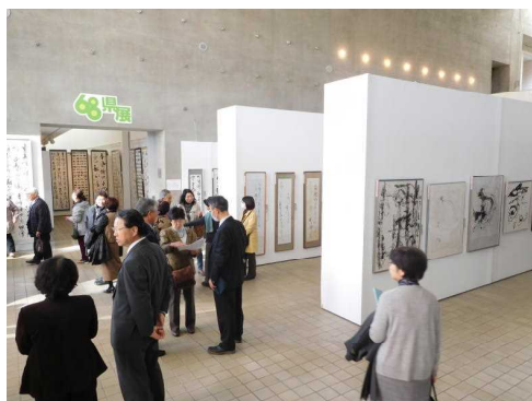
第68回群馬県書道展覧会(県民芸術祭)

皆様からお寄せいただいた寄附金を活用し、県文学賞や県展、小中学校伝統芸能教室、GUNMA マンガ・アニメフェスタなど、計121事業を実施し、235,194人に参加いただきました。