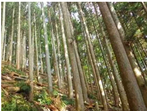
森林整備(間伐)の状況

「ぐんま緑の県民基金事業」では、皆様からお寄せいただいた寄附金を活用し、地理的・地形的な条件が悪く放置されている森林などを整備し、災害に強い森林づくりを行いました。また、野生獣類の出没抑制や通学路の安全確保など、地域の実情に合わせた竹林や里山の整備を行い、安全・安心な生活環境の改善に取り組みました。さらに、児童生徒などを対象とする森林環境教育を実施し、森林の機能や重要性について学んでもらうとともに、貴重な動植物を保護する活動も実施しました。