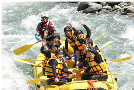
夏の群馬で楽しめるウォーターアクティビティ

平成29年度は、水源県ならではの「水」、ぐんま県境稜線トレイルなどの「山」をテーマに7～9月の3ヶ月間、夏の群馬の魅力を集中的にPRしました。