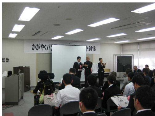
障害者アスリートによる事業報告会の様子

皆様からお寄せいただいた寄附金を「パラアスリート発掘・育成事業」として活用し、大会遠征費、指導経費等の補助を行うことで、障害者アスリートの競技力向上につなげることができました。