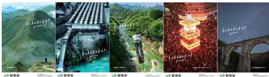
全国のJR主要駅等に掲示する5連ポスター

皆様からお寄せいただいた寄附金は、県の魅力をPRするため、ググっとぐんま観光キャンペーンとあわせ、全国のJR主要駅等に掲示する5連ポスターの作成に活用させていただきました。