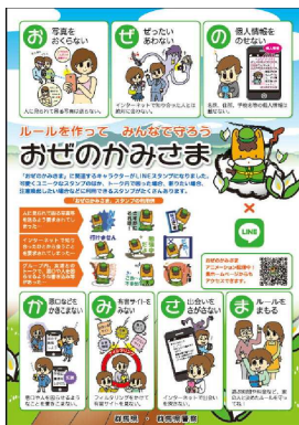
「おぜのかみさま」リーフレット

皆様からお寄せいただいた寄附金は、「おぜのかみさま」の普及・啓発活動のため、有効に活用させていただきました。