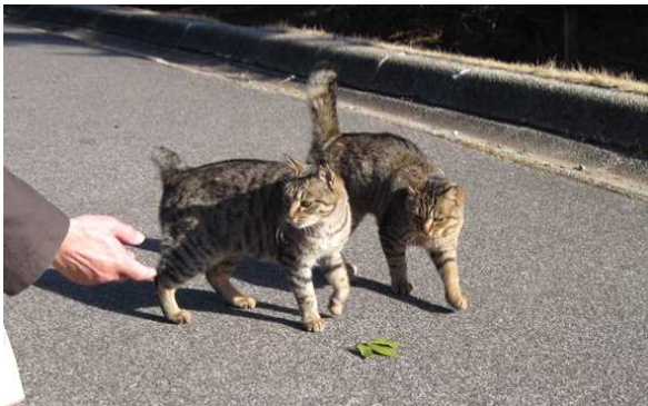
飼い主のいない猫対策支援事業で手術を受けた猫