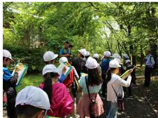
森林環境教育の様子