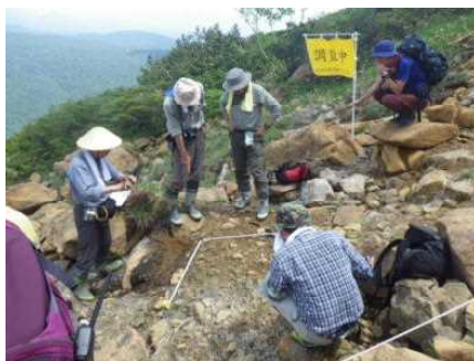
至仏山での植生回復事業の様子

皆様からお寄せいただいた寄附金を活用し、至仏山の荒廃防止対策として、登山道の補修や周辺の植生回復作業を行うことができました。