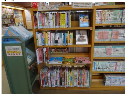
子ども読書相談室(新しく買った本)

皆様からお寄せいただいた寄附金を活用し、購入した子ども用図書は、県立図書館へ来館した子どもたちや図書館のない町村に住む子どもたちなどに幅広く利用されています。