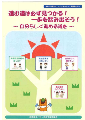
学校を離れてしまった子ども・保護者向けパンフレット

皆様からお寄せいただいた寄附金の活用により、困難を抱えた子どもが自分から前向きになり、社会的自立に向けた一歩を踏み出しました。