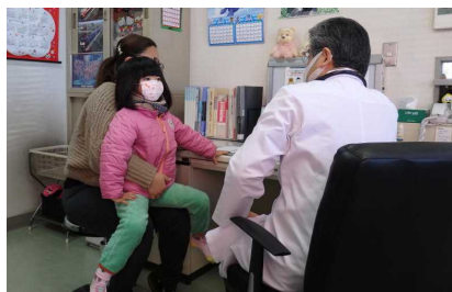
小児科を受診する子ども

皆様からお寄せいただいた寄附金は、子ども医療費助成事業の財源の一部として活用させていただきました。