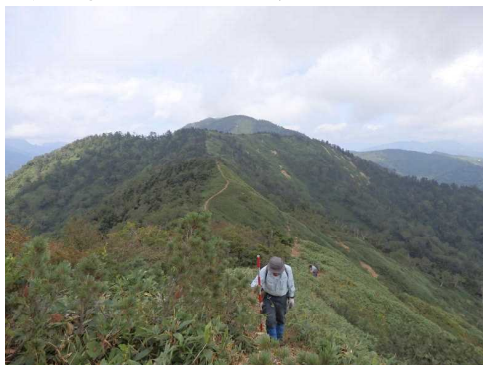
「ぐんま県境稜線トレイル」未開通区間の測量作業

皆様からお寄せいただいた寄附金を活用し、未整備となっている三坂峠～白砂山(中之条町)の登山道整備や、既設登山道の改修等の作業を行うことができました。