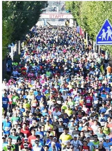
「ぐんまマラソン」スタート

皆様からお寄せいただいた寄附金は、「ぐんまマラソン」の開催に活用させていただきました。