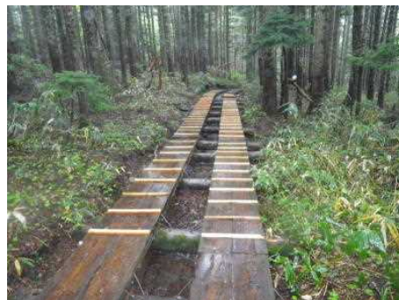
県管理木道修繕(栈木打ち)