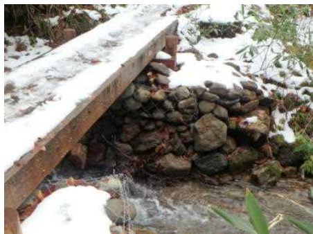
県管理木道橋修繕(橋台補修)

皆様からお寄せいただいた寄附金を活用し、県管理木道、木道橋の補修や木道に栈木を打つための資材購入などを行い、尾瀬を訪れた登山者の方に、安全な木道を整備することができました。