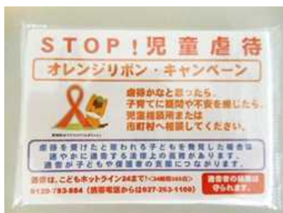
オレンジリボンキャンペーングッズ

皆様からお寄せいただいた寄附金は、オレンジリボンキャンペーンでの広報啓発活動等に有効に活用させていただきました。