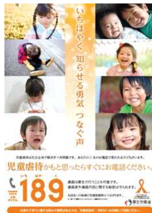
「児童虐待防止推進月間」ポスター