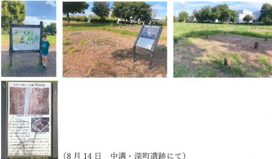
(8月14日 中溝・深町遺跡にて)