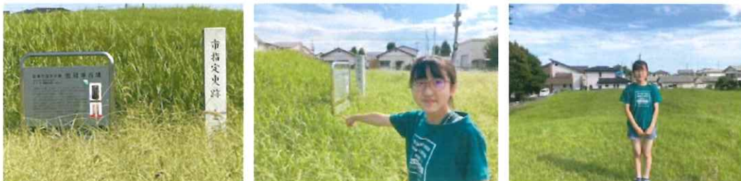
(8月14日 山王金冠塚古墳にて)