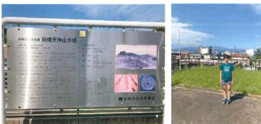
(8月14日 前橋天神山古墳にて)