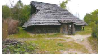
(3年前 矢瀬遺跡にて)