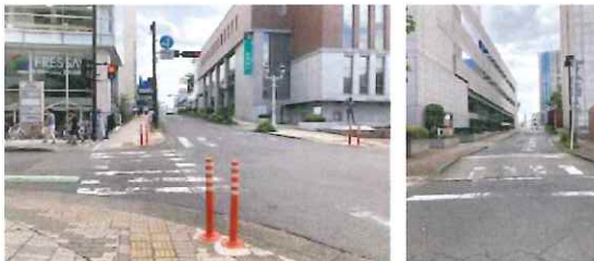
(本町 群銀前橋支店北、東和銀行本店北)