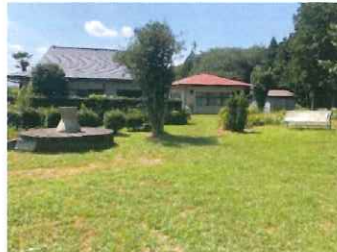
(2年前 三原田遺跡にて)