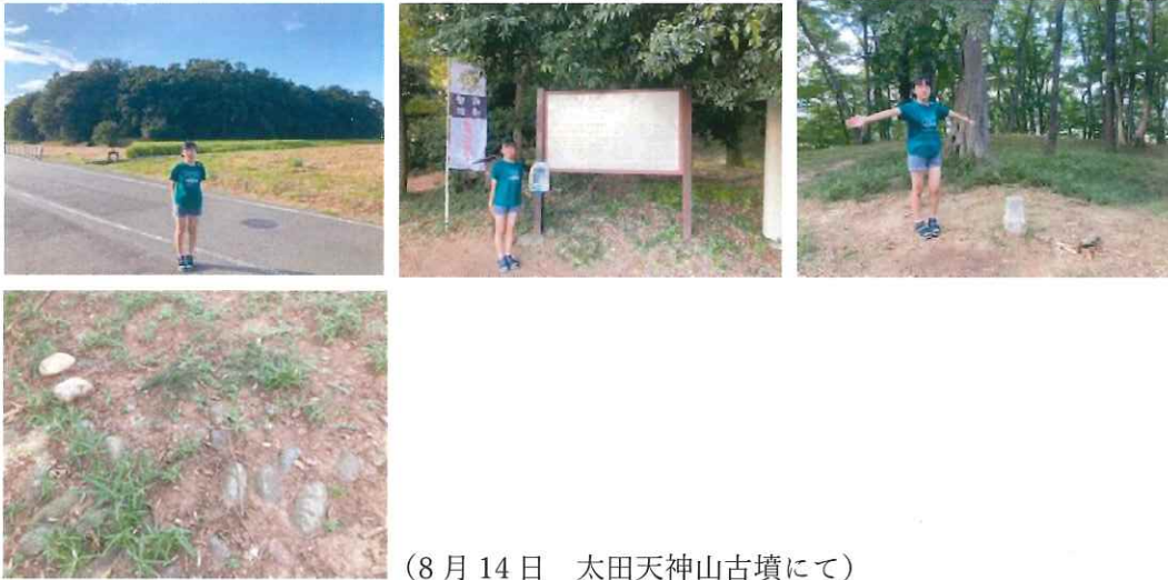
(8月14日 太田天神山古墳にて)