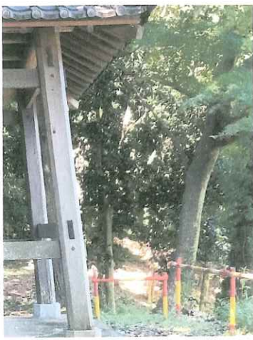
後円部から見た前方部