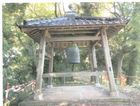
後円部にある梵鐘