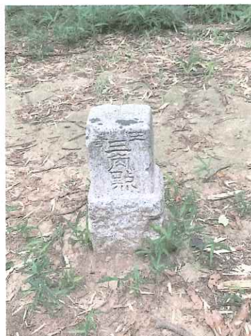
後円部にある三角点