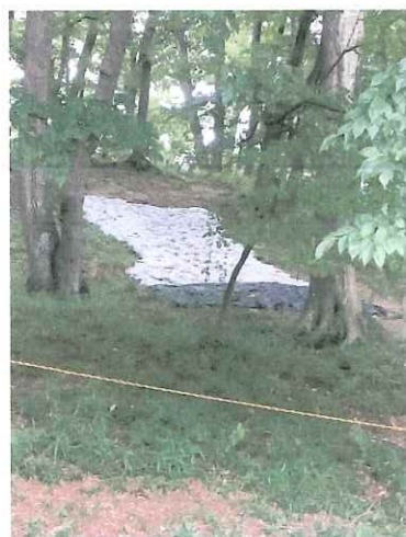
石室の入り口と思われる場所