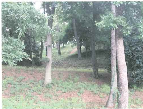
手前:前方部、奥:後円部