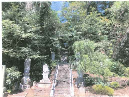
古墳正面(薬師堂正面)