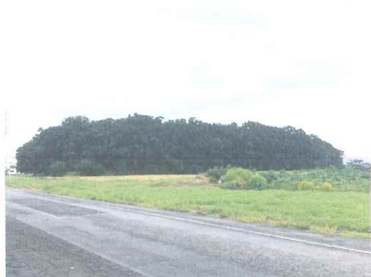
全体(左:前方部、右:後円部)