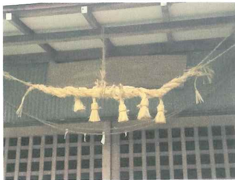
天満宮の神額としめ縄