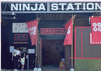
岩櫃真田忍者ミュージアム・にんぱく