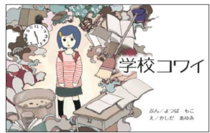
大阪市教育委員会第13回「はーと&はーと」絵本原作コンクール奨励賞受賞作品