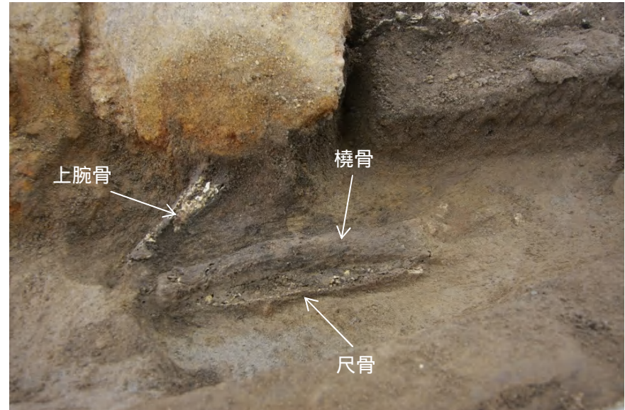
2. 右腕と手の検出状況(第2回詳細調査)