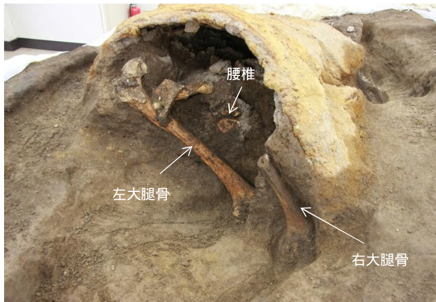
3. 甲着装人骨の骨取り上げ後の状況