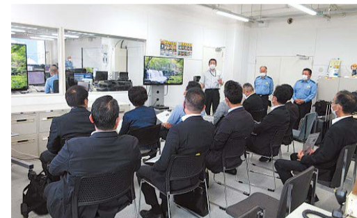
青森県警察本部で説明を受ける様子

新たな通信指令システムの活用状況及び特殊詐欺対策の取組について調査を行いました。