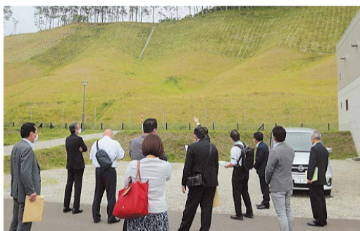
厚真町の復興状況を調査する様子

平成30年に発生した北海道胆振東部地震発生当時の状況や対応、復興状況について調査を行いました。