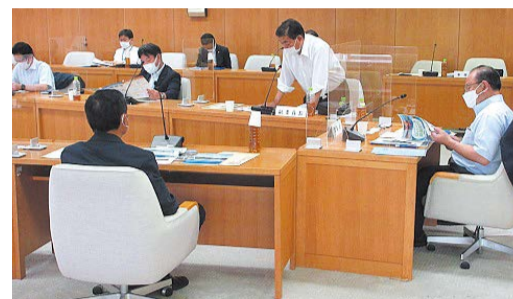
兵庫県庁で調査する様子

地域高規格道路である山陰近畿自動車道の全面開通に向けた取組について調査を行いました。