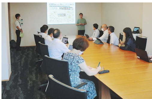
B's 行善寺で説明を受ける様子

社会福祉法人佛子園が展開する障害福祉サービスや介護福祉サービス等に取り組む同複合施設について調査を行いました。