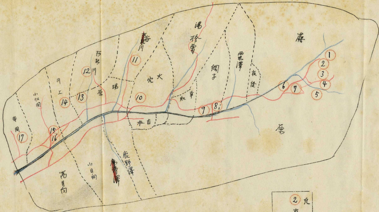
古墳分布圖面 群馬縣利根郡水上村