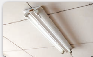
業務用・施設用蛍光灯の安定器