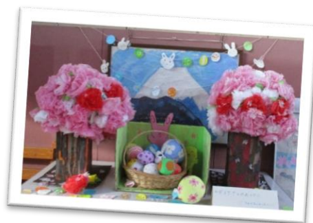
デイケアのみなさんの作品です。春らしい色使いで、可愛らしく玄関を飾りました！