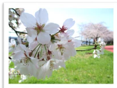
今年のさくら 令和3年3月29日撮影

敷地内は四季折々の様々な景色が見られます。グラウンドや遊歩道とともに、引き続きご活用ください。