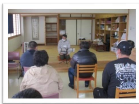
デイケアの落語プログラム