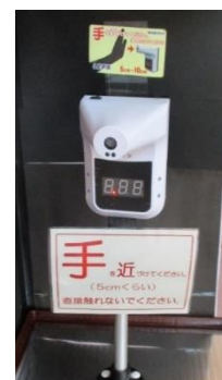
手をかざして計測する体温計を導入しました。