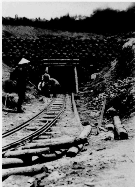
第2号横坑口(第4号隧道下口及第5号隧道上口) 昭和11年(1936)