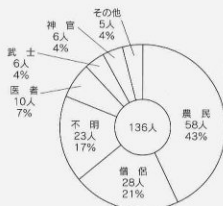
勢多郡域における寺子屋・私塾の師匠の身分 (『群馬県教育史』第1巻より作成) (『群馬県史』通史編6より)

この史料は、江戸時代の手習いの手本です。江戸時代の中期以降、寺子屋（手習塾、手習所ともいう）は庶民の教育機関として各地にできました。寺子屋の教育内容は、「読み・書き」の二科目を教えたところか最も多く、次いで「算術（そろばん）」を加えた三科目を教えたところもありました。しかし、中心は習字で、手習うことを通して手習い読ませ、文字や文章の意味を理解させようとした。ここから、法令・教訓・消息（手紙文）・地理・歴史・産業・理数などに関する様々の手習手本（往来物という）が作られ、用いられました。