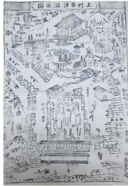
上州草津温泉圖 (高橋氏収集文書)

当館に収蔵されている江戸時代の温泉関係の古文書や絵図などを通して、江戸時代の草津・伊香保・四万・沢渡など主要な温泉のにぎわいや温泉と文化・産業の関わり、温泉地で起きた事件などを紹介しています。「温泉王国 ぐんま」の歴史をいろいろな角度から眺めてみてください。