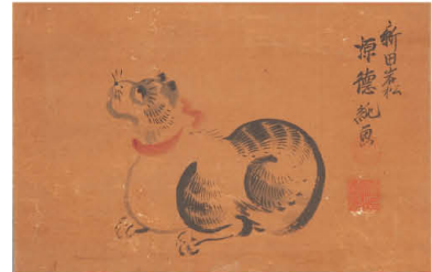
新田徳純筆猫絵 (本館蔵)

本展では本館所蔵の新田猫絵を紹介し、群馬県の養蚕文化の一端に触れていただきます。