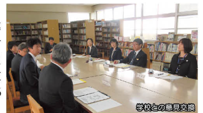
学校との意見交換

西小学校との連携や進路指導の取り組みについて説明を受けた後、校内を視察しました。委員から「将来の自立を見据えた教育が図られていた」と報告がありました。