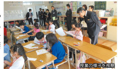
授業の様子を視察

外国人児童の受け入れ状況や日本語学級の様子を中心に視察しました。委員から「みんな楽しそうで安心した」「初期指導の重要性を感じた」と報告がありました。