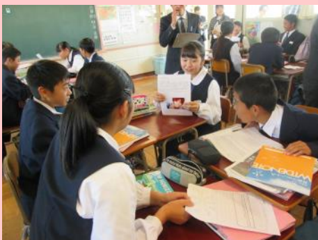
意見を交わしながら学ぶ生徒（館林市立第三中学校）