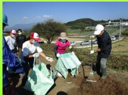
地域の人たちと交流し学ぶ生徒（県立渡良瀬特別支援学校）