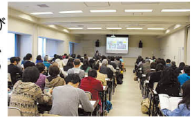
子育て支援フォーラムの様子

今回は、「親としての学び」及び「親になるための学び」プログラムを体験し、子育てについての悩みの共有、気づき、交流を行うことを目的とします。ぜひご参加ください。