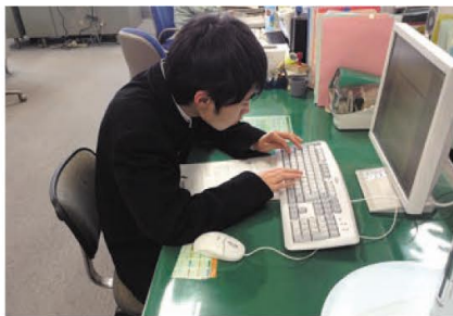
パソコン入力の様子

特別支援学校の生徒たち32人が、将来、一般の企業などで働くことを目標に1月10日から1カ月間、県庁や県の出先機関で体験実習「職場体験ファーストステップ」を行っています。