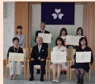
「群馬県男女共同参画社会づくり功労者表彰」及び「ぐんま輝く女性表彰」