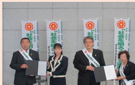
“社会を明るくする運動” 内閣総理大臣メッセージ等伝達式