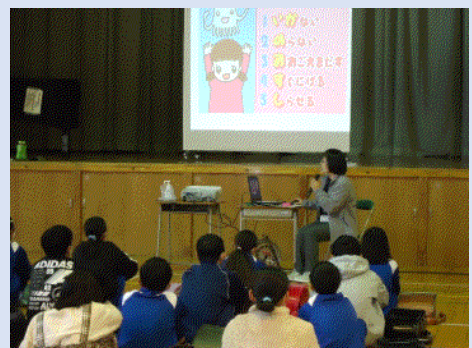
子ども向け防犯出前講座の様子