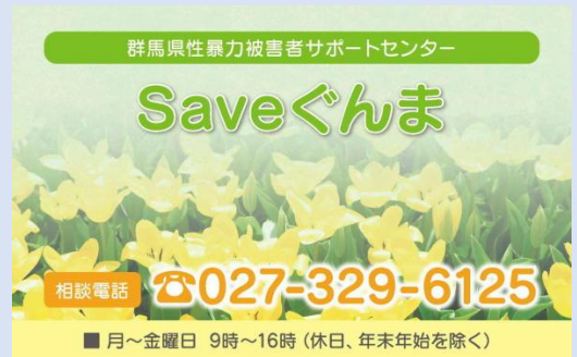
「Saveぐんま」周知カード