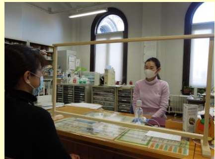
NPO・ボランティアサロンぐんま