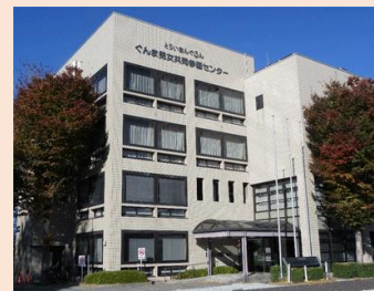
ぐんま男女共同参画センター