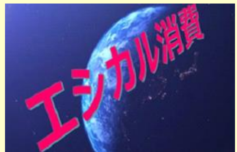
普及啓発動画「『エシカル消費』ははじめませんか。」