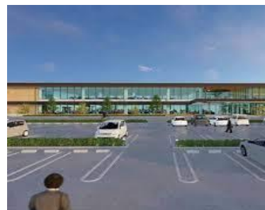
BIMで作成した建設イメージ

また、BIM業務においては、建物の設計の段階で完成後のイメージができることから、顧客満足度の向上にも貢献しています。BIMのスキルが高いため、日本人スタッフに指導してもらっています。